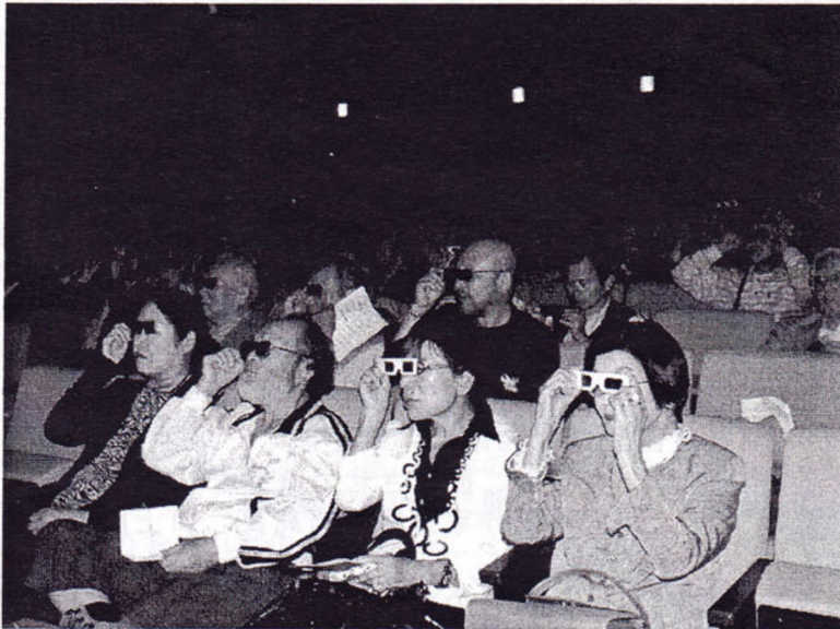
本日一番の呼びもの、3D映像の視聴風景 (インターネットOMC会報にも多数写真があります。)