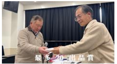
最多 20 出品賞